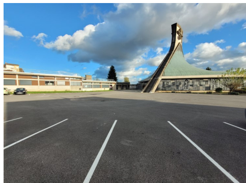
Parking Saint Jean - 2022

Trop de projets d'urbanisme n'ont pas intégré le rôle des végétaux et créent des îlots de chaleur qui empêchent la température de baisser durant les nuits de canicule.