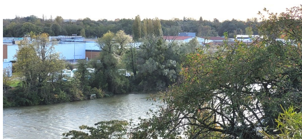
Futur parc urbain, en rive gauche du Doubs

... mais dans des zones déjà enherbées ou arborées.