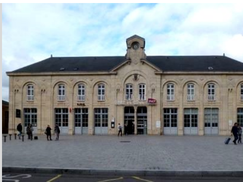
Parvis de la gare - 2014