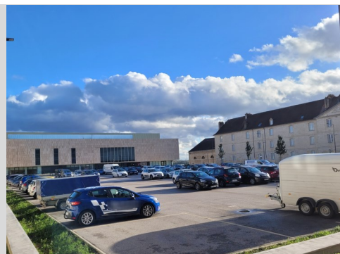
Place Precipiano - 2021